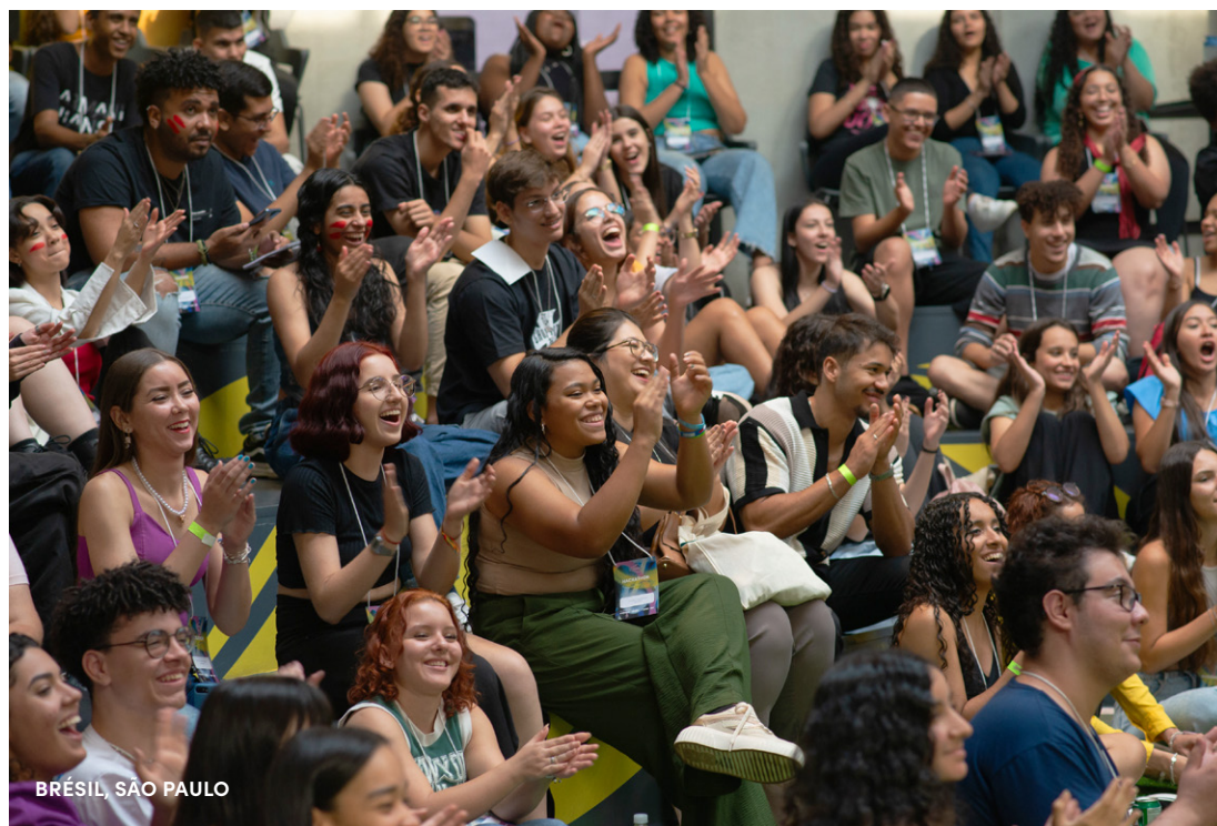
BRÉSIL, SÃO PAULO