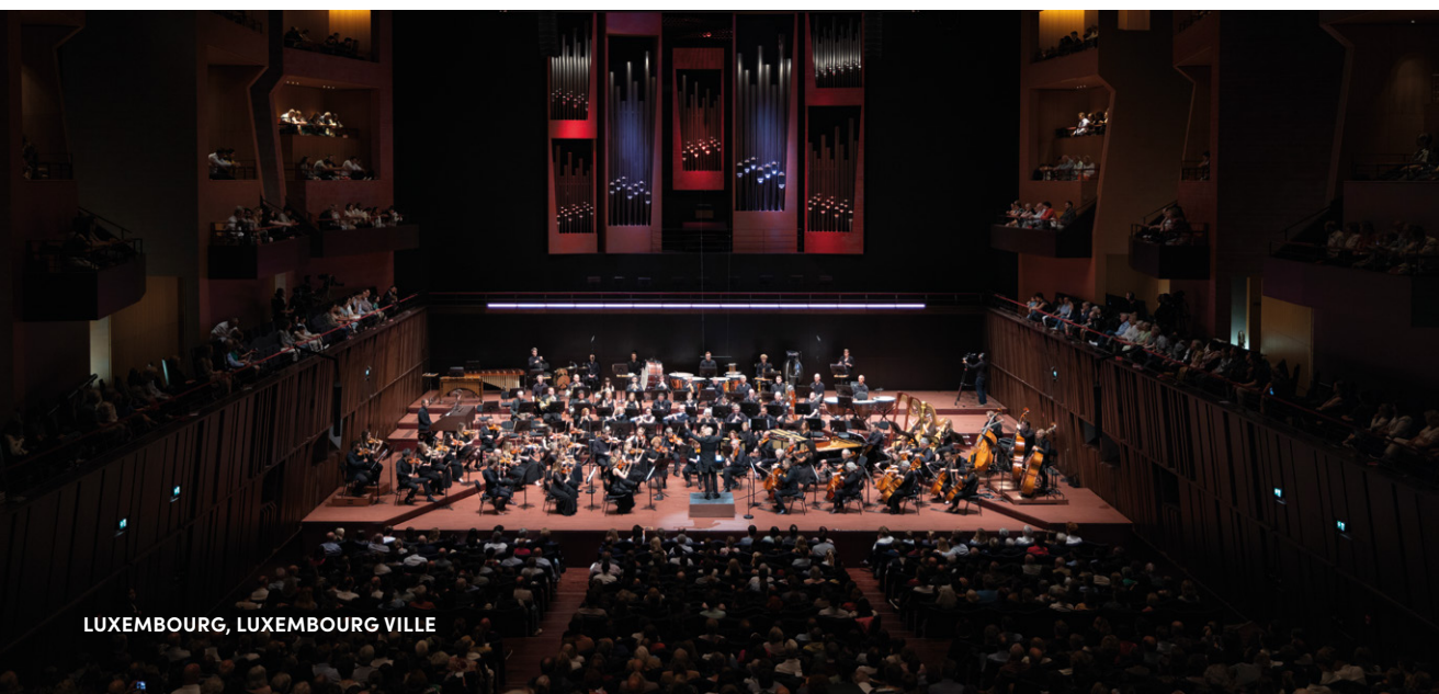
LUXEMBOURG, LUXEMBOURG VILLE

spectateurs réunis dans le Grand auditorium